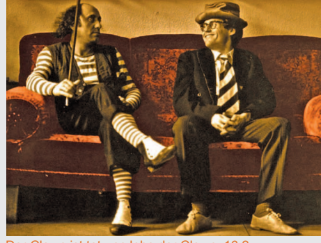
Der Clown ist tot - es lebe der Clown_16.2.