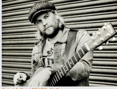
Sebel & QuickBEATS_24.2.