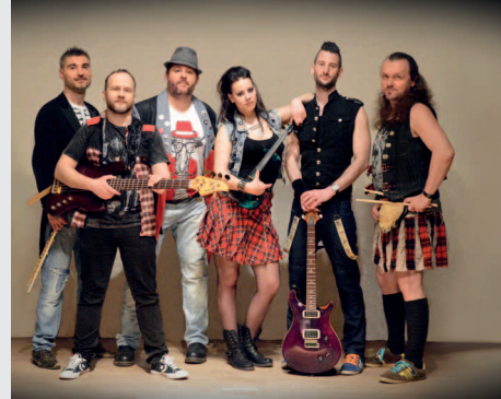
Folk und Rock im Schloss

Freitag, 7.7., 20 Uhr Schlosshof Strünkede