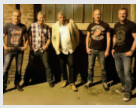
Kirmes warm-up - 28.-30.7_Exit u.a.