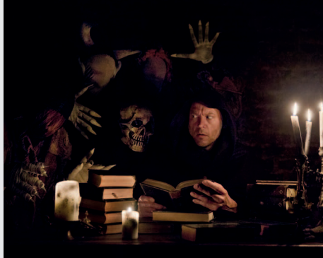
Ich fürchte nichts... N.N. Theater Neue Volksbühne Köln

Freitag, 7.7., 19:30 Uhr Flottmann-Hallen