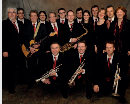
Big Band XXL Doppelkonzert: Blechwerk und JazzFazz

Zum zweiten Mal treffen sich namhafte Bands zum „Big-Band-XXL“-Konzert auf der Bühne der Flottmann-Hallen.