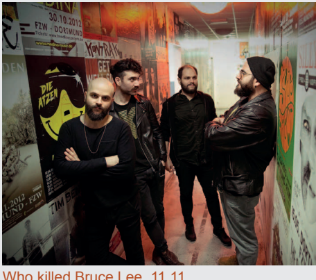
Who killed Bruce Lee... 11.11.