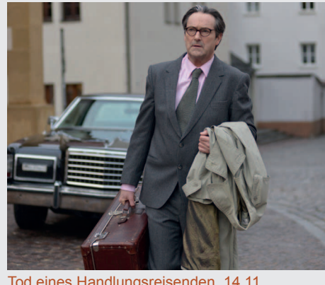
Tod eines Handlungsreisenden... 14.11.