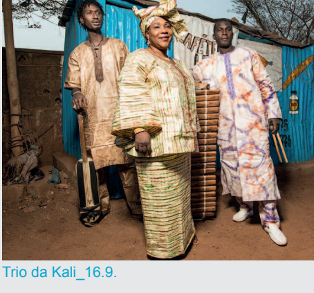
Trio da Kali_16.9.