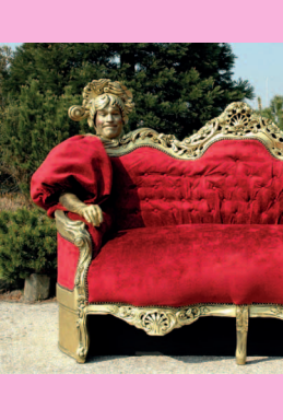
Tukkers Connexion: Couch

11.6., 15 Uhr Sonntagsführung Heimatmuseum Unser Fritz 25.6.-21.7.2018 Sonderausstellung: Zwischen allen Stühlen Schloss Strünkede - großes Eröffnungsfest: 25.6. (s. Kalender)