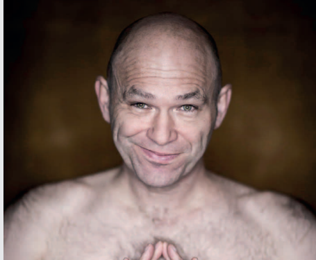
Der unglaubliche Heinz_13.6