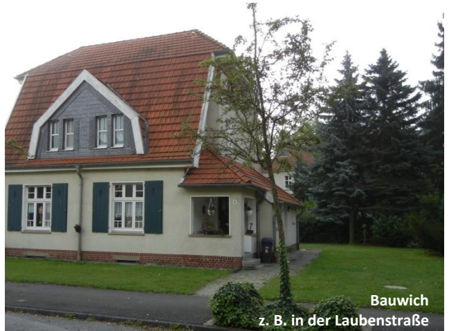
Bauwisch z. B. in der Laubenstraße