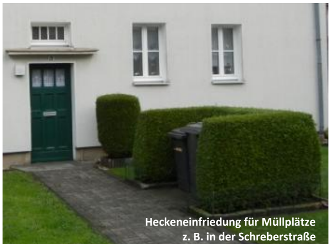
Heckeneinfriedung für Müllplätze z. B. in der Schreberstraße