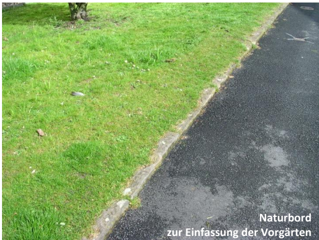
Naturbord zur Einfassung der Vorgärten