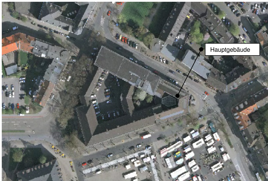
Abbildung 1: Liegenschaftsübersicht