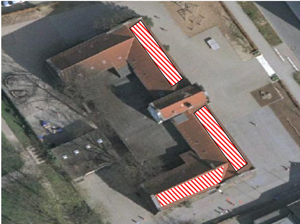
Abbildung 2: Hauptgebäude