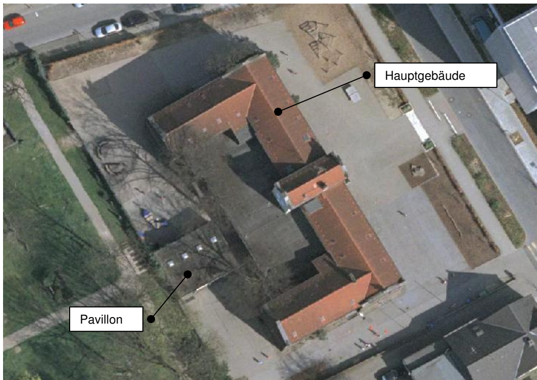
Abbildung 1: Liegenschaftsübersicht