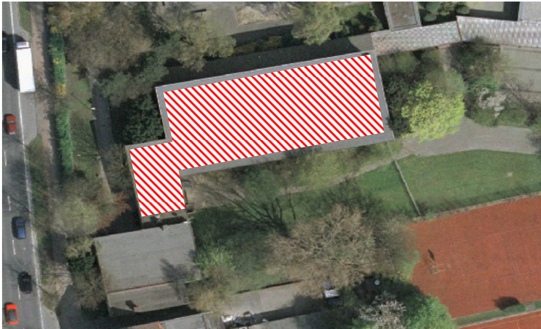
Abbildung 3: Sport-/Schwimmhalle