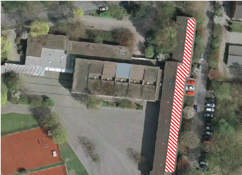
Abbildung 2: Hauptgebäude