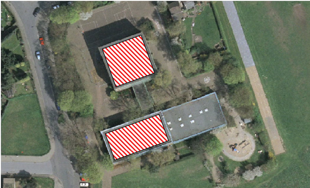
Abbildung 2: Hauptgebäude