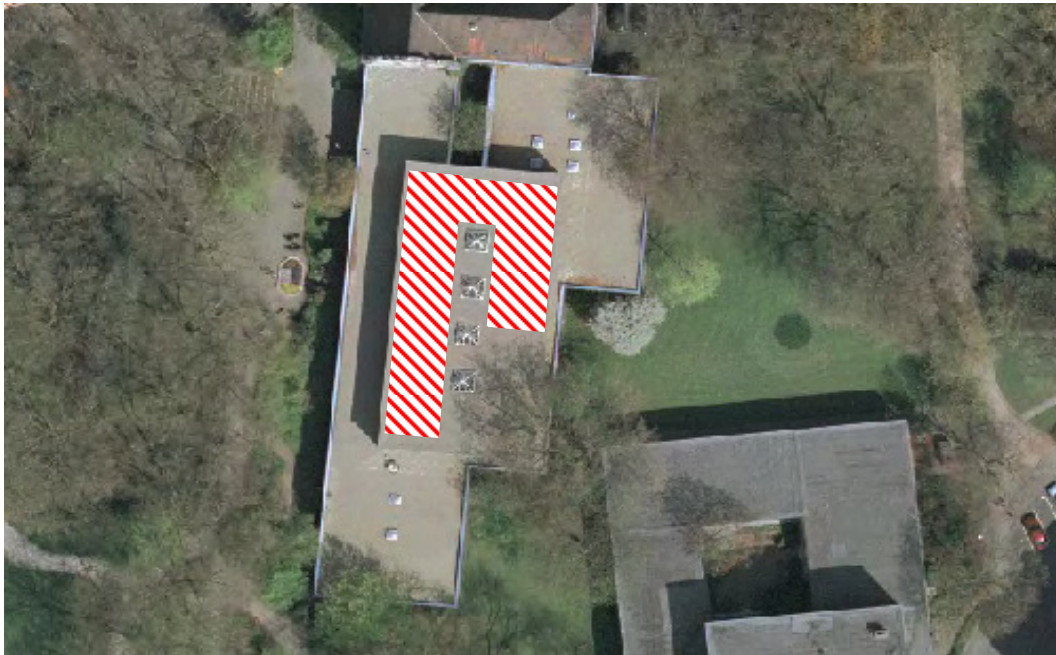
Abbildung 2: Hauptgebäude