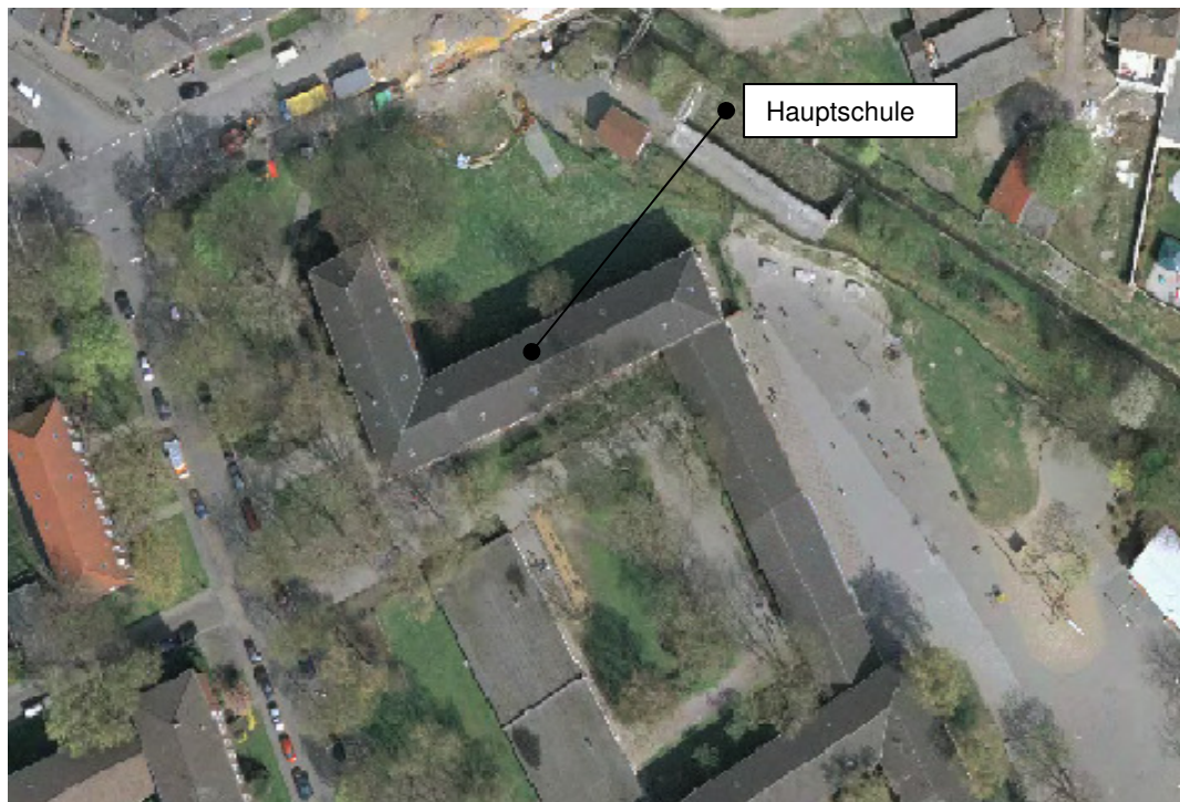
Abbildung 1: Liegenschaftsübersicht