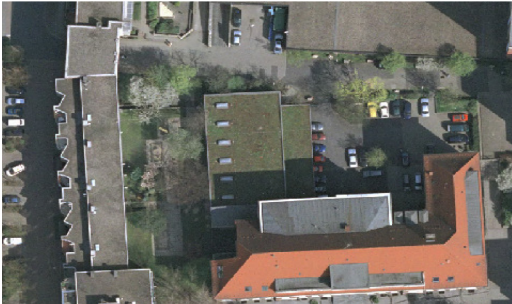
Abbildung 3: Sporthalle