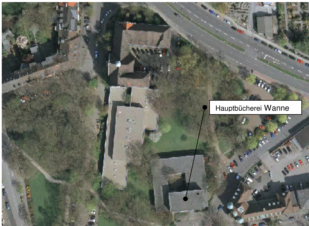
Abbildung 1: Liegenschaftsübersicht