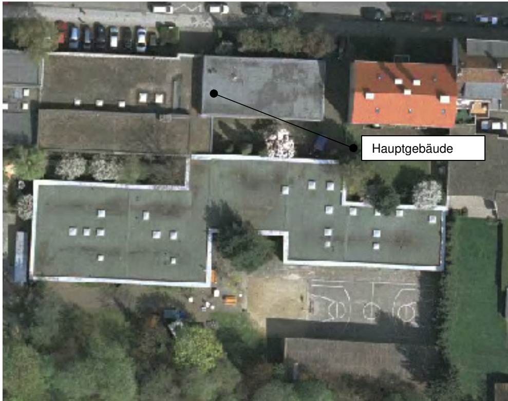
Abbildung 1: Liegenschaftsübersicht