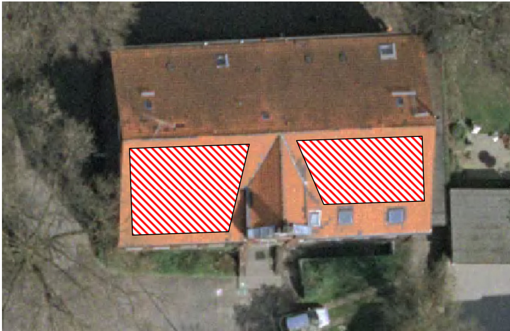
Abbildung 2: Hauptgebäude