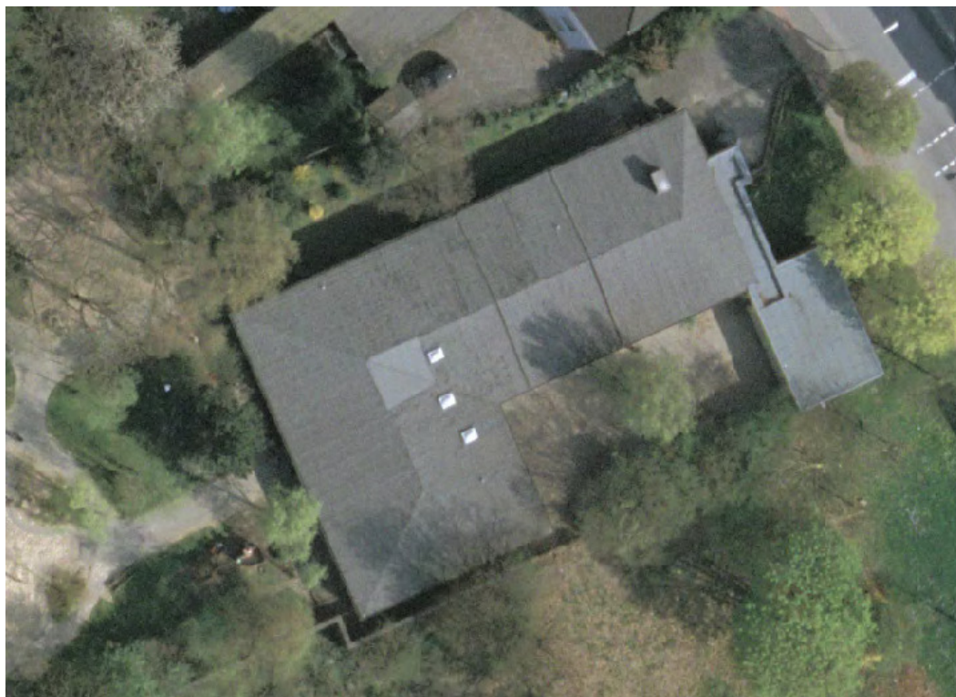
Abbildung 1: Liegenschaftsübersicht