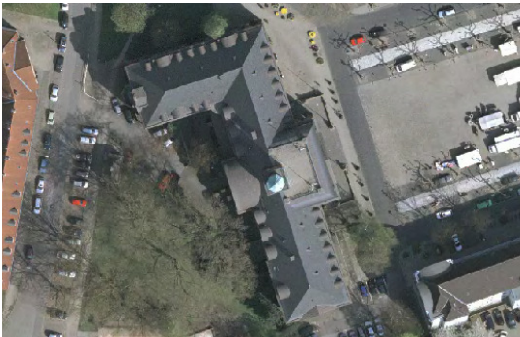
Abbildung 2: Rathaus Herne