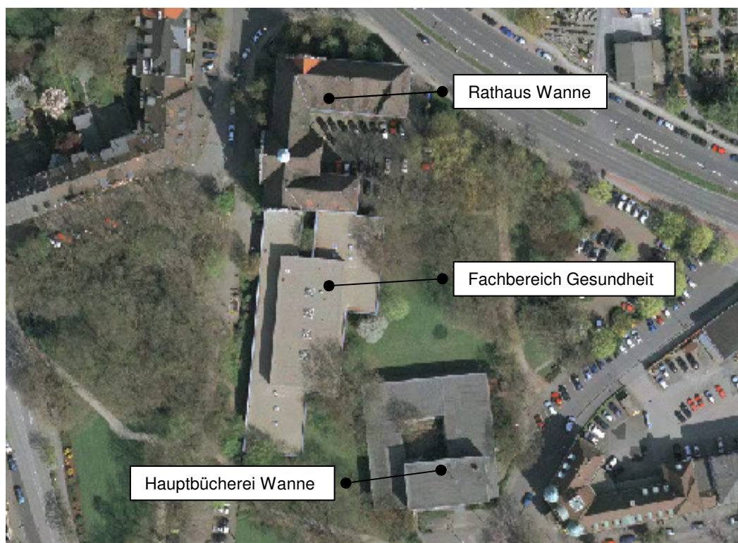
Abbildung 1: Liegenschaftsübersicht