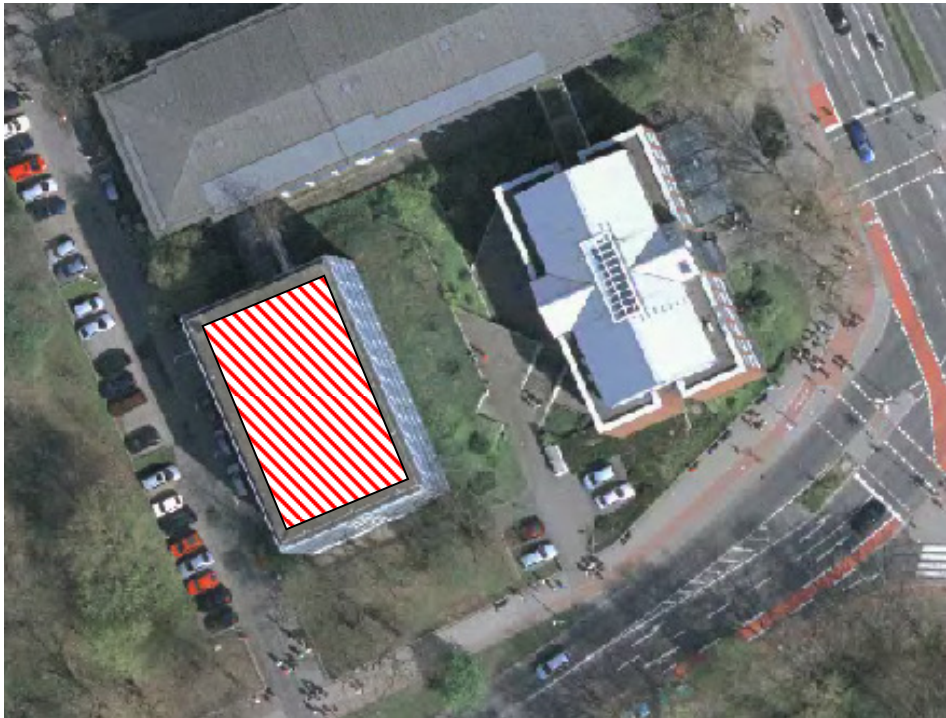
Abbildung 2: Hauptgebäude