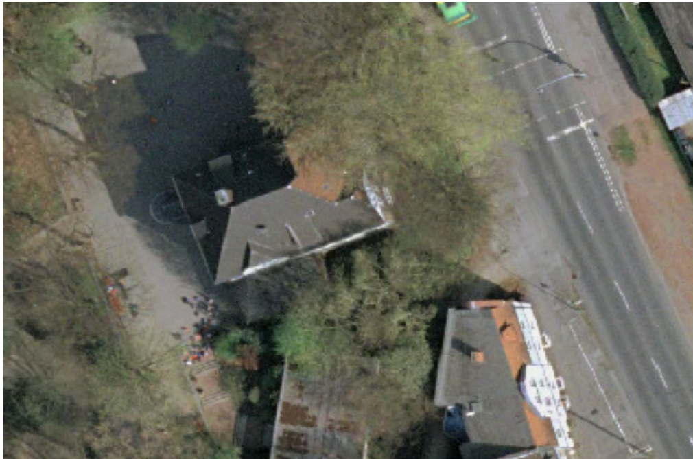
Abbildung 2: Hauptgebäude