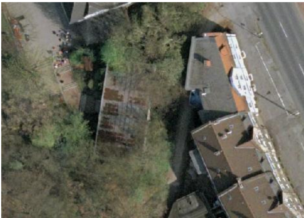
Abbildung 3: Pavillon