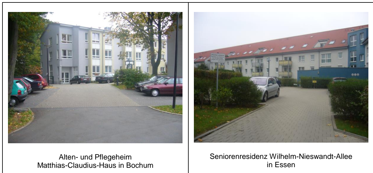
Abbildung 6: Stellplatzanlagen vorhandener Wohnanlagen in Bochum und Essen

⇒ Die Wohnanlage Betreutes Wohnen Am Bleckmannshof in Bochum weist somit bei insgesamt 21 Wohnungen keine eigenständigen Stellplätze auf.