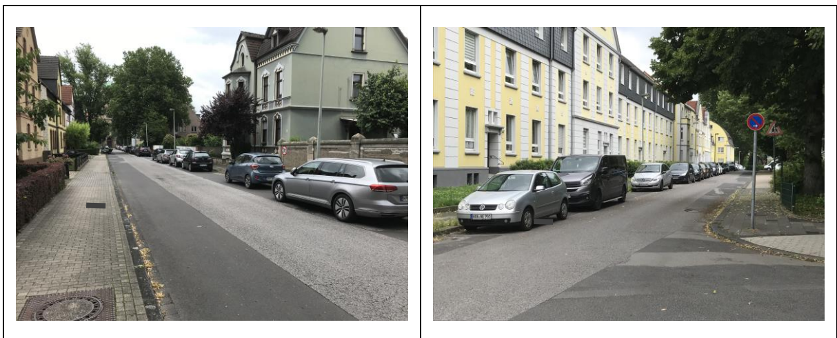
Abbildung 3: Typische Parkraumbelastung im öffentlichen Straßenraum der Gabelsberger Straße