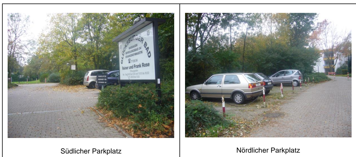
Abbildung 5: Stellplatzanlage Wohnanlage Glücksburger Straße in Bochum