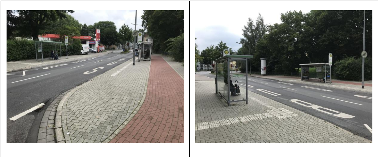
Abbildung 7: Vorhandene Ausstattung der Haltestelle „Dürerstraße“

Das eigene Wohnumfeld der künftigen Bewohner ist als Startpunkt der täglichen Mobilität der bestimmende Faktor, um die individuelle Verkehrsmittelwahl zu beeinflussen. Gibt es beispielsweise bereits vor der eigenen Haustür attraktive Voraussetzungen und Angebote für den Fuß- und Radverkehr, den ÖPNV oder für Sharing-Angebote, fällt es leichter auf den privaten Pkw zu verzichten und stattdessen umweltfreundliche Systeme zu nutzen. Für das geplante Vorhaben besteht bereits über die beiden barrierefrei ausgebauten Haltestellen „Dürerstraße“ im Einmündungsbereich Gabelsberger Straße / Eickeler Bruch und „Im Sportpark“ im Zuge der Hauptstraße eine gute ÖPNV-Anbindung.