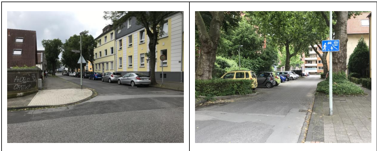
Abbildung 2: Typische Parkraumbelastung im öffentlichen Straßenraum der Harkortstraße

Aus den Beobachtungen vor Ort an verschiedenen Tagen und unterschiedlichen Uhrzeiten zeigt sich im Tagesverlauf eine durchgehend hohe Belegung der öffentlichen Stellplätze. In der Ferienzeit sind die Senkrechtstellplätze unmittelbar am Schulgrundstück entsprechend geringer frequentiert. Dennoch lässt sich im Hinblick auf die geplanten Wohnnutzungen aus der bestehenden Parkraumsituation die dringende Empfehlung formulieren, dass der zusätzliche Stellplatzbedarf des geplanten Vorhabens innerhalb des Plangebietes abgedeckt werden sollte, da in dem umgebenden Bestandsstraßennetz keine signifikanten Stellplatzreserven zur Verfügung stehen.