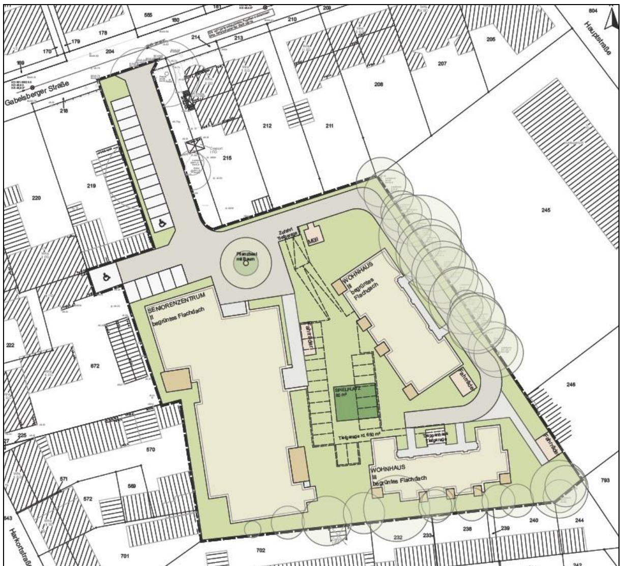
Abbildung 1: Vorhaben- und Erschließungsplan

Die Weyers Planungs- und Projektentwicklungsgesellschaft mbH beabsichtigt in der Stadt Herne eine bauliche Entwicklung eines Blockinnenbereichs südlich der Gabelsberger Straße. Auf dem Grundstück sollen drei Baukörper mit Wohnnutzungen und ambulanten Betreuungs- und Pflegeangeboten für Senioren errichtet werden, die sich um einen großen Innenhof gruppieren. Das städtebauliche Konzept zielt auf eine Entwicklung des Blockinnenbereiches in ein generationsübergreifendes Wohnquartier ab. Konkret sollen am Standort ein Gebäude für Verwaltungsräume und Wohnungen mit ambulanten Betreuungs-/Pflegeangeboten des Deutschen Roten Kreuz sowie zwei Mehrgenerationenhäuser entstehen. Das Gelände wird zukünftig von der nördlich angrenzenden Gabelsberger Straße erschlossen.