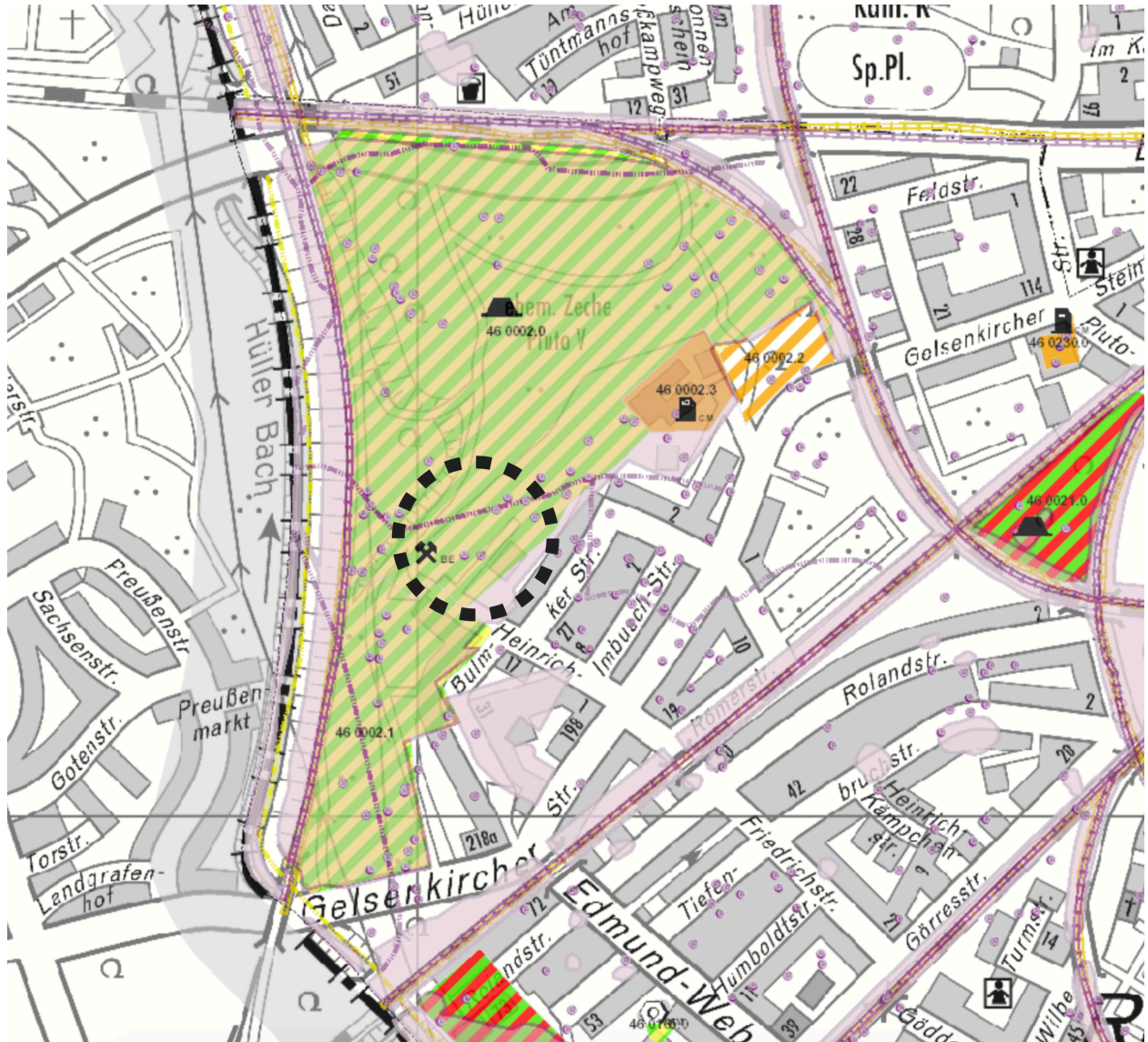
Abbildung 3: Auszug aus dem Altlastenkataster der Stadt Herne

Das Altlastenkataster der Stadt Herne kennzeichnet den Vorhabenstandort als Altlastenverdachtsfläche mit der Katasternummer 460002.0. Hier befindet sich der ehemalige Standort der Zeche Pluto V, für den laut Altlastenkataster Sicherungsmaßnahmen gemäß § 2 Abs. 7 Nr. 2 BBodSchG durchgeführt wurden.