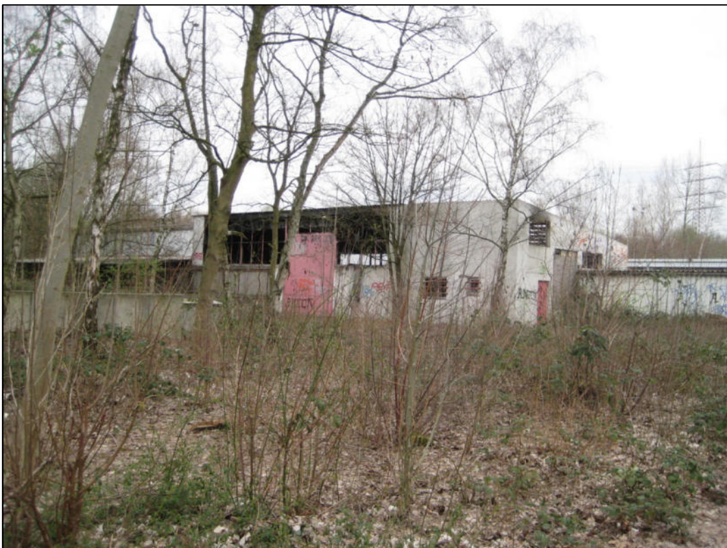
Abb. 3: Ausgebrannte Hallen östlich des Plangebietes