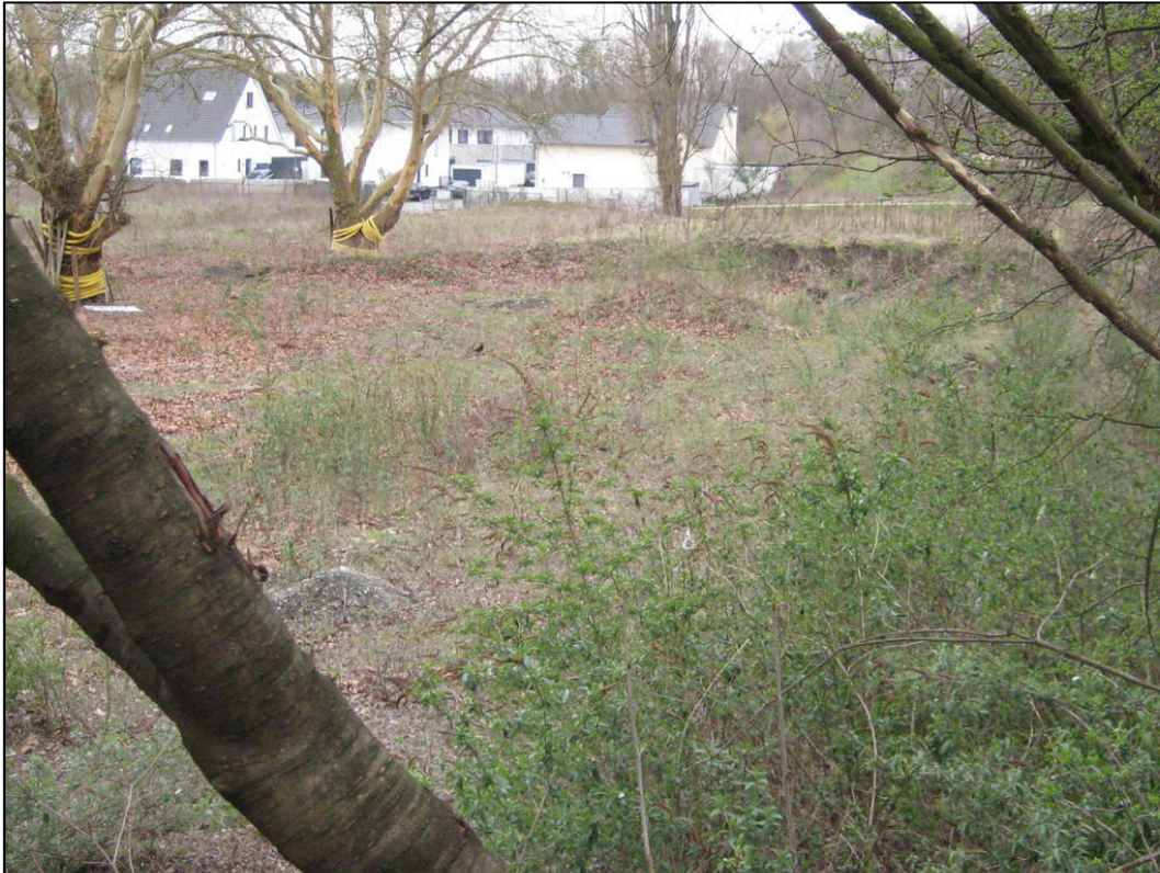
Abb. 4: Plangebiet von Nordosten betrachtet mit Gehölzbestand und der Bodenmitte/Böschungsanriss