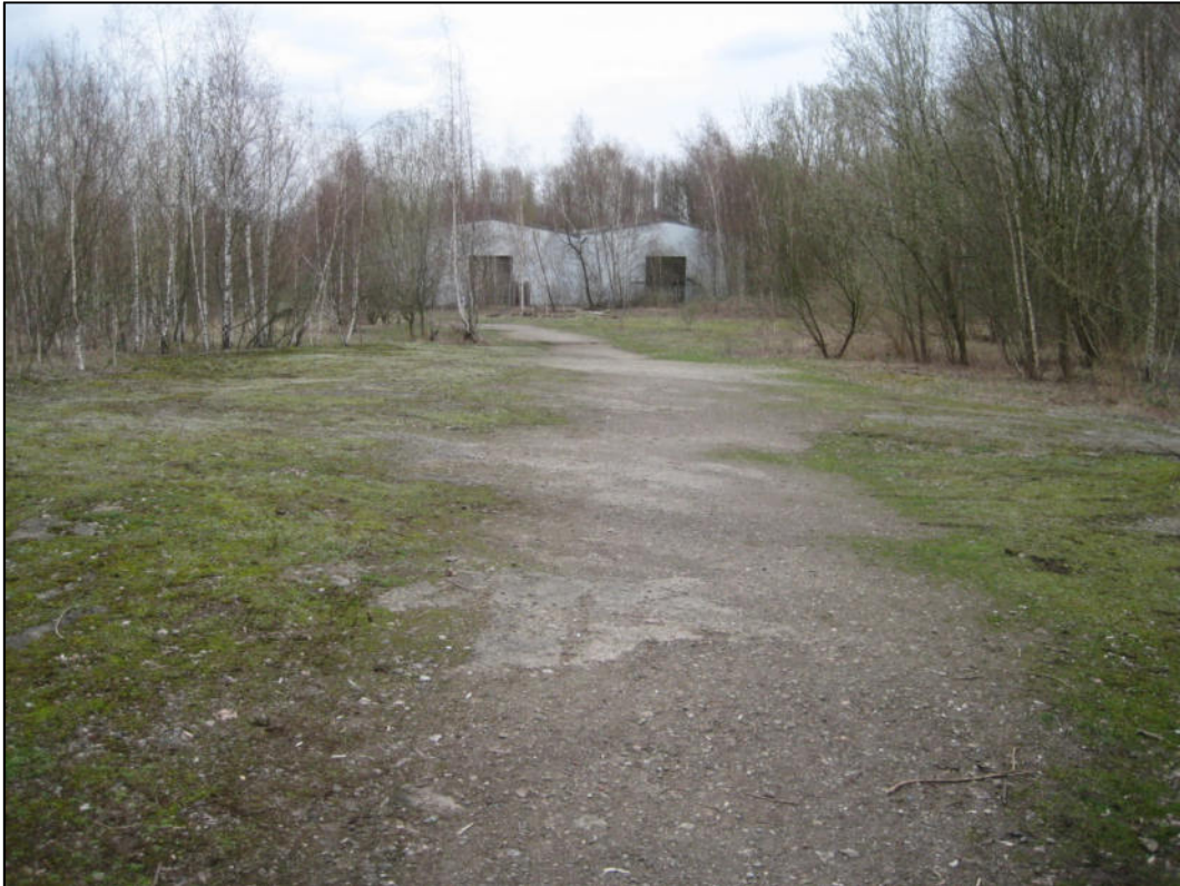
Abb. 2: Halboffene Strukturen östlich des Plangebietes