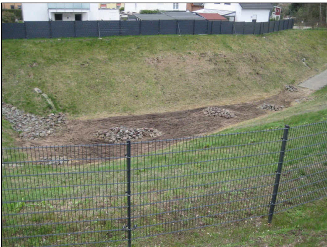
Abb. 6: Kreuzkrötenerersatzlebensraum (Reproduktionsstätte) in einem Regenrückhaltebecken, das trotz einer langen Niederschlagsperiode trocken und ohne Wasserführung ist.