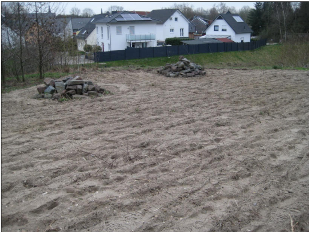
Abb. 5: Kreuzkrötenersatzlebensraum (Landhabitat) auf einer Geländehöhe westlich der Heinrich-Imbusch-Straße