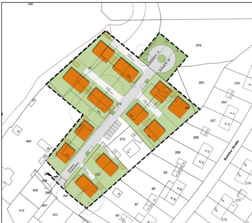
Abb. 1: Lageplan – Plangebiet farblich hervorgehoben (Flurstück 373 ist nicht im städtebaulichen Konzept enthalten – Bestandssicherung).

Planungsrelevante Arten wurden im Plangebiet und Umfeld während der Ortsbegehung nicht angetroffen.