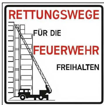
Abbildung 2: Schild 2 - Rettungswege

Die Schilder sind im Bereich der Begrenzung der Aufstellfläche zu positionieren. Der Bereich der Aufstellfläche ist durch entsprechende Maßnahmen vor einer missbräuchlichen Benutzung (z.B. als Parkfläche) zu sichern. Dies kann durch Umsetzung einer der folgenden Maßnahmen geschehen: