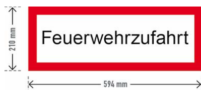
Abbildung 3: Schild 3 - Feuerwehrezufahrt

Die Feuerwehrezufahrt ist gegen missbräuchliche Nutzung zu sichern. Hierzu ist eine der beschriebenen Maßnahmen a) bis f) unter dem Punkt „Flächen für die Feuerwehr“ umzusetzen.