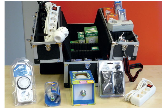
Bestandteile des Sparpakets des Caritasverband Herne e.V.

Der Caritasverband Herne e. V. bietet für Menschen, die Arbeitslosengeld II, Sozialhilfe oder Wohngeld beziehen einen Energiesparservice an.